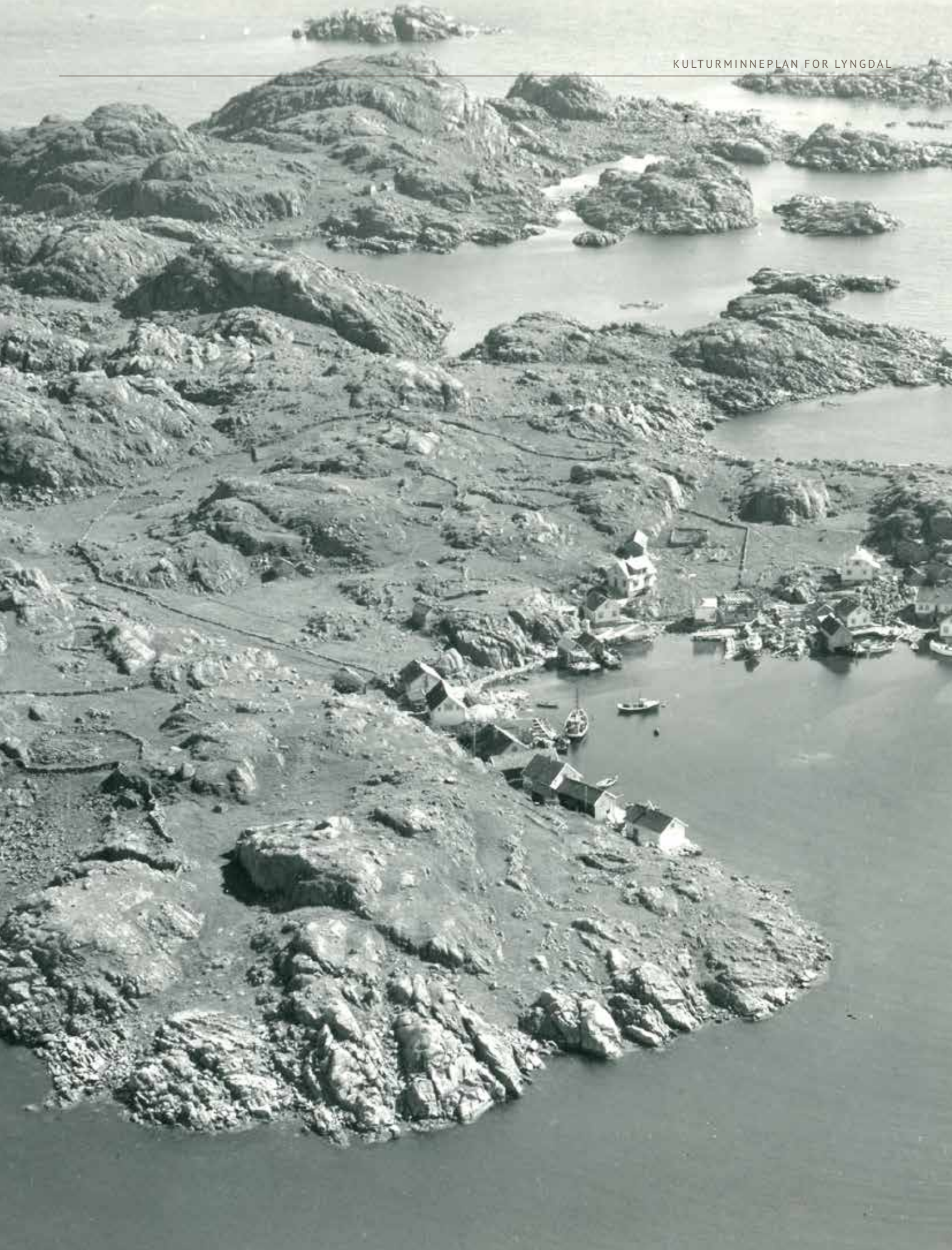
Østre Sælør sett fra luften 18. juni 1949