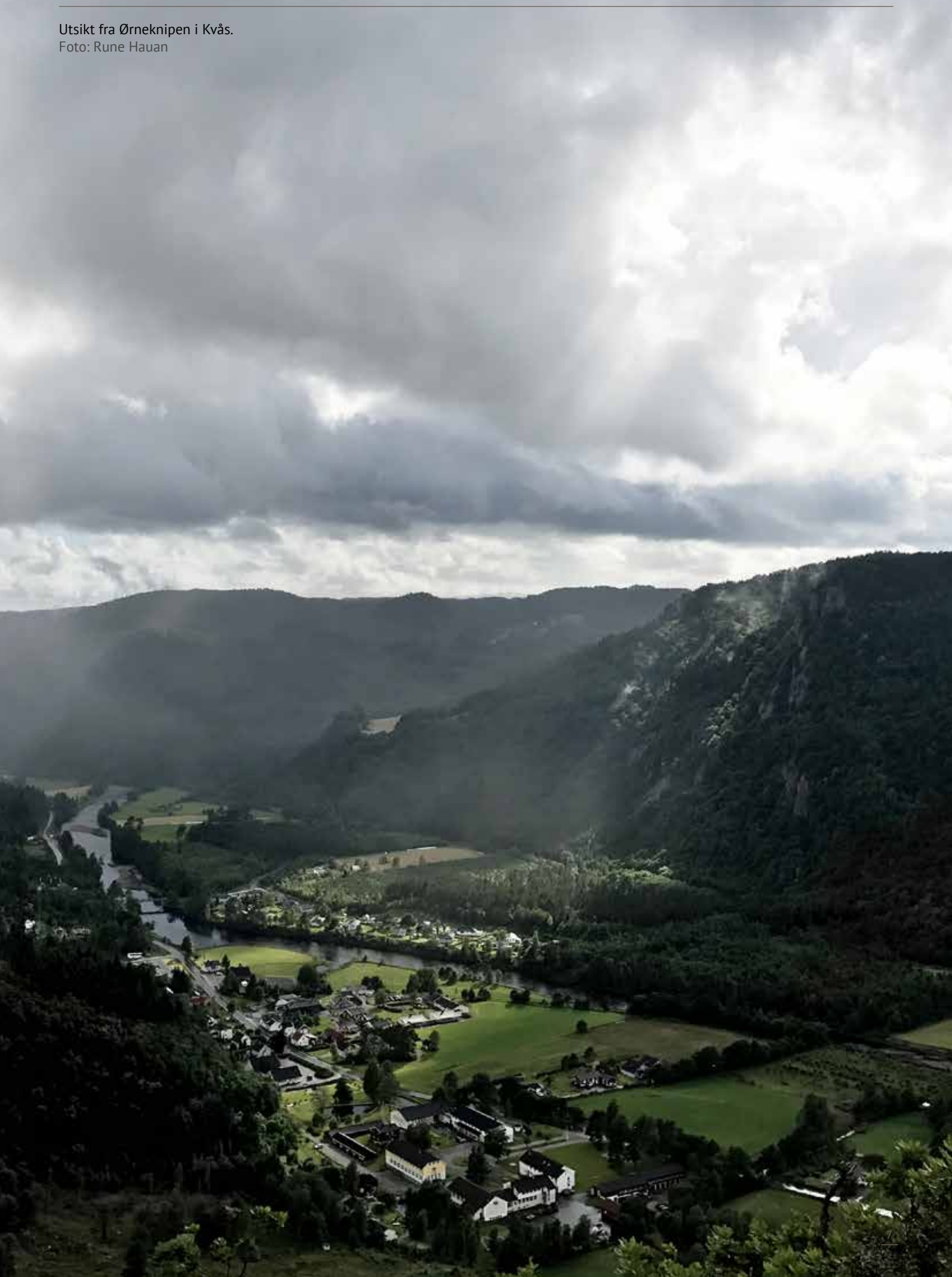
Utsikt fra Ørneknipen i Kvås.