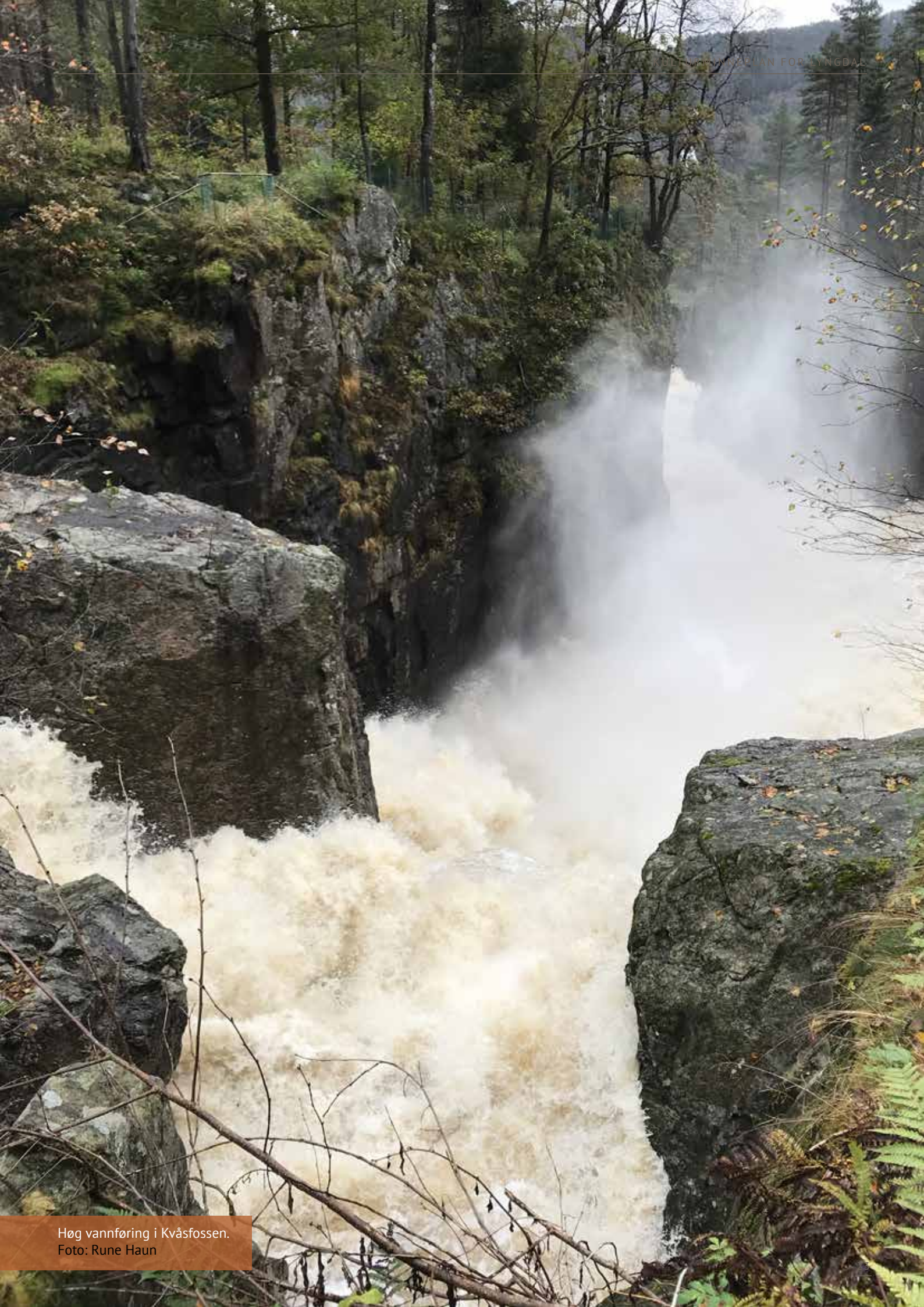
Høg vannføring i Kvåsfossen.