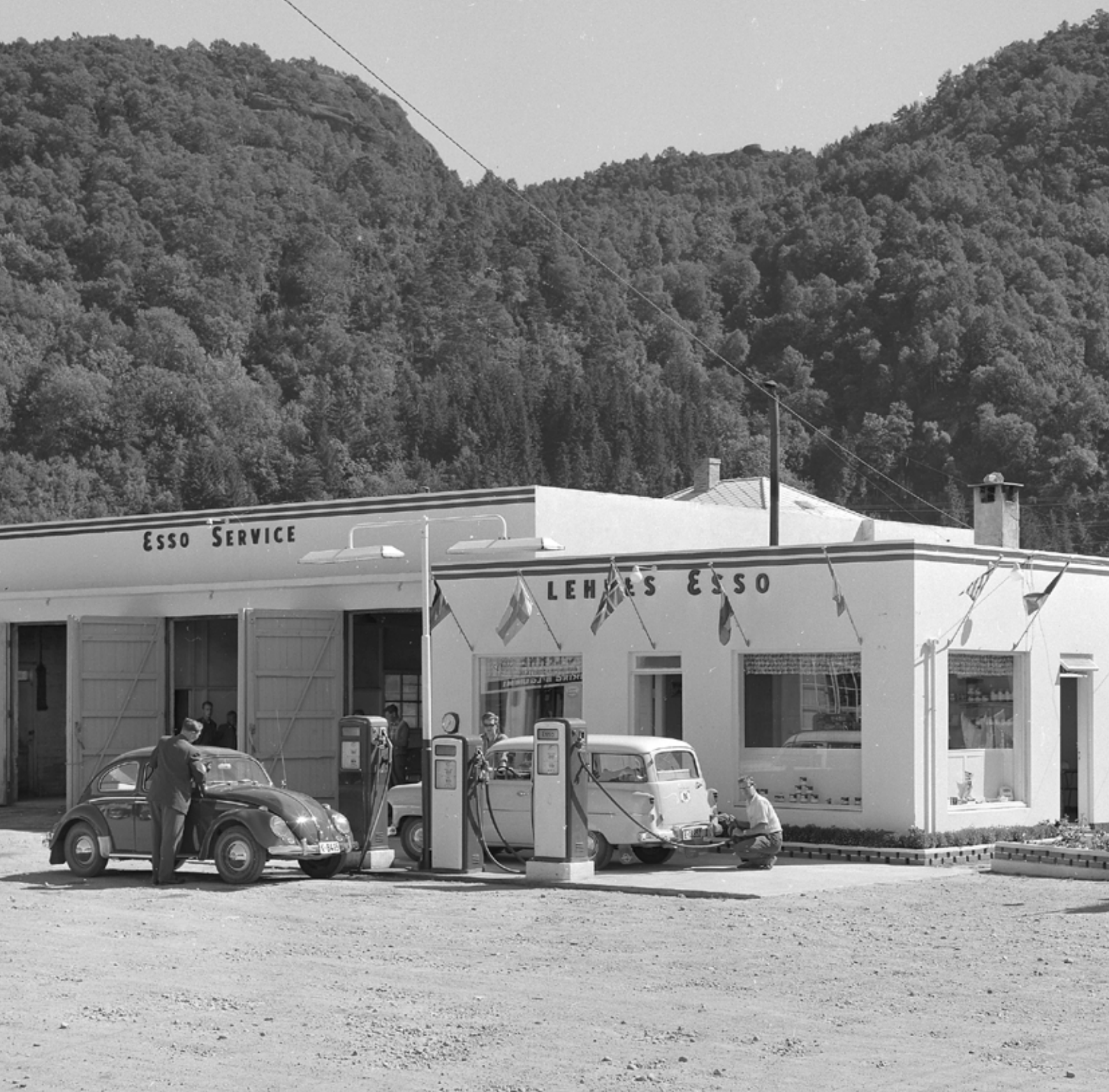
«Tappen» til Carl Lehne. Også kontor for lastebileiernes sentral.