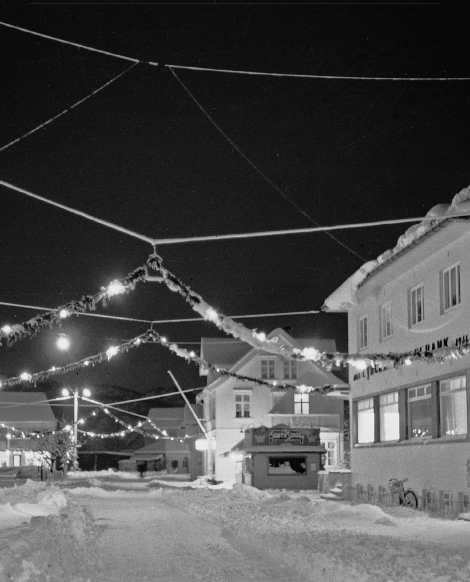
Lyngdal sparebank. Kiosken til O. Sletta og huset til Larsen med kafé.