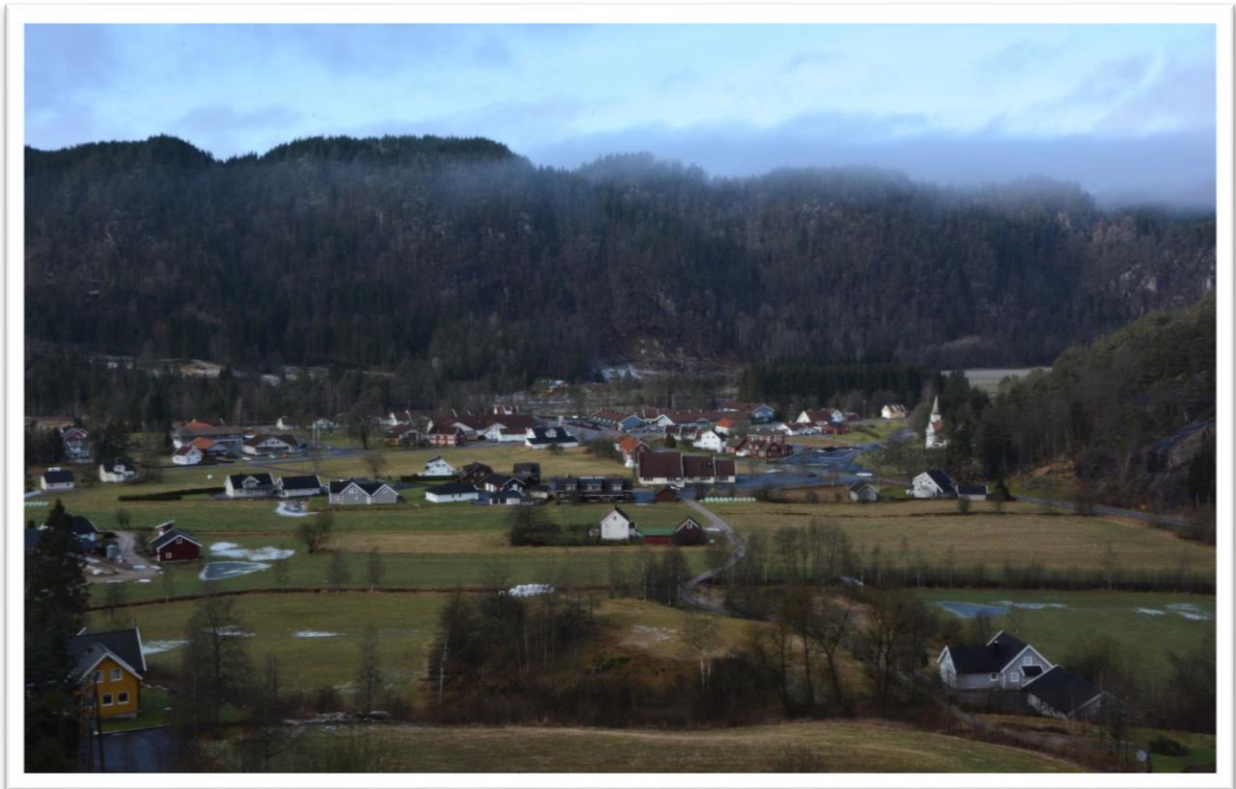
Panorama Kongsmo, februar 2020.

Infoen utgis av Samskaping og innovasjon, Lyngdal kommune. I redaksjonen: Ole Aa. Brattfjord, Hallgeir Fiddan og Marius H. Thoresen