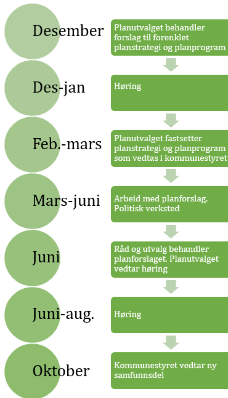
Figur: Fremdriftsplan for planprosessen